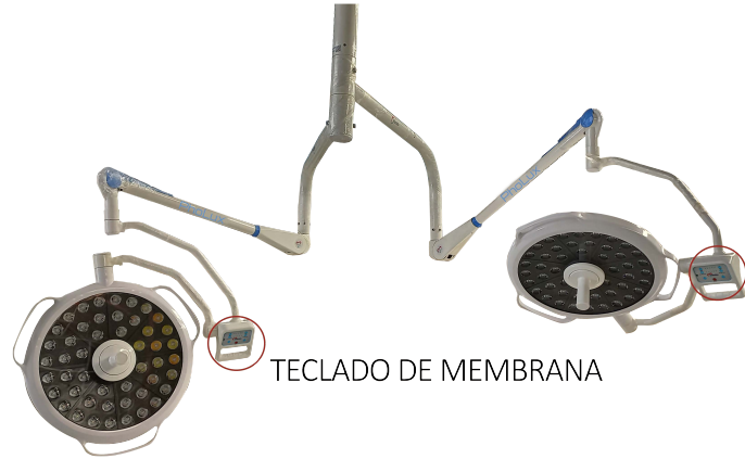
TECLADO DE MEMBRANA